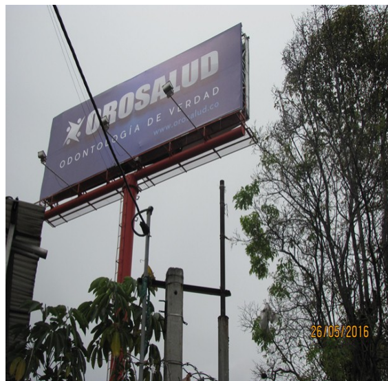
Foto 2. Texto de la Publicidad